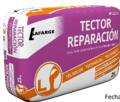
Fecha de fabricación y detalle del producto impreso en los laterales del saco